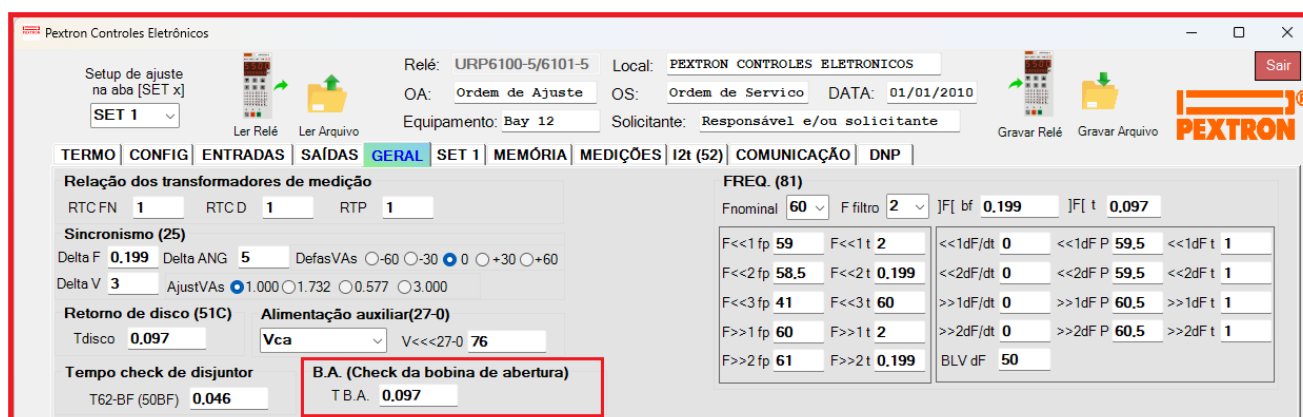
Figura 15.1: Pasta GERAL sinalizando a unidade de supervisão da bobina de abertura (BA).

A programação do parâmetro é realizada na pasta GERAL do programa aplicativo de configuração e leitura do relé. A figura 15.1 sinaliza o parâmetro disponível da unidade de supervisão da bobina de abertura (BA).